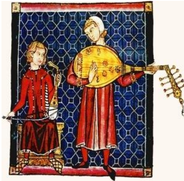
Miniature du XII e siècle, bibliothèque de l'Escurial, Madrid.