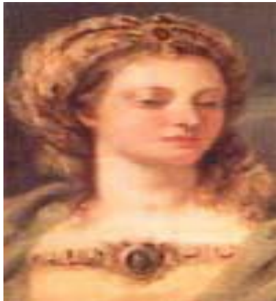
Hodierna, comtesse de Tripoli (1110 – 1164).