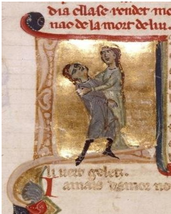
La mort de Jaufré Rudel dans les bras de la comtesse de Tripoli.