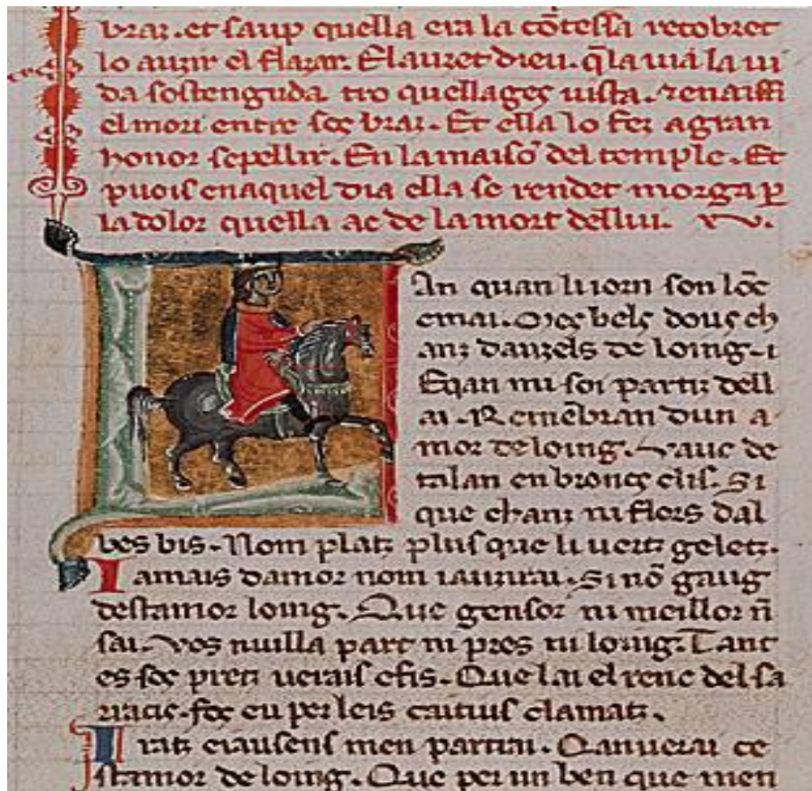
Jaufré Rudel. Initiale ornée (XII e -XIII e siècle) extraite d'un chansonnier provençal. Bibliothèque nationale de France, Paris.