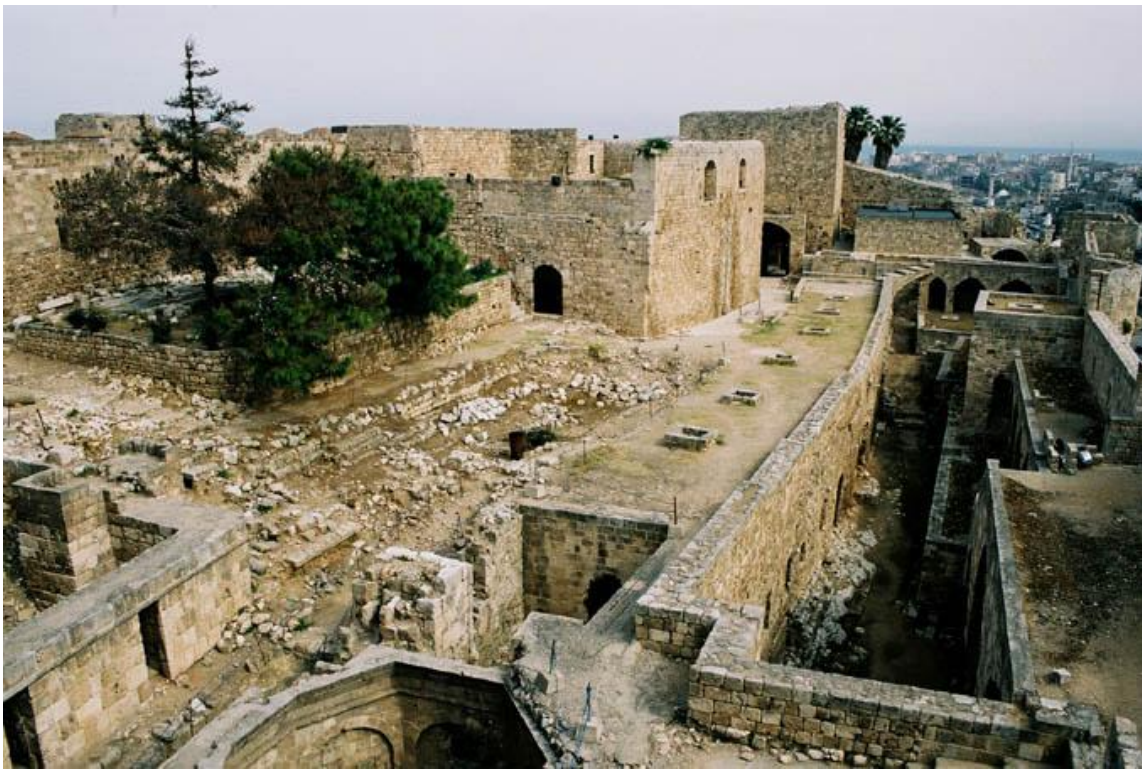
Ruines du château Saint-Gilles à Tripoli (Liban).